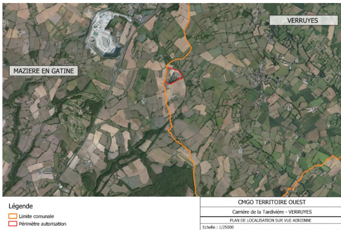
Figure 2 : Localisation de la carrière de VERRUYES sur vue aérienne