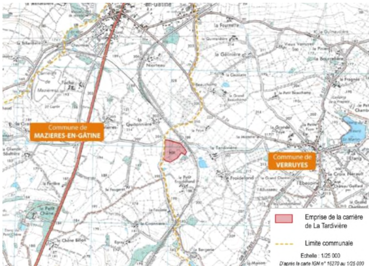
Figure 1 : Localisation de la carrière de VERRUYES sur fond IGN